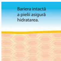
Bariera protectoare cutanată intactă cu lipide bogate în acizi linoleici.

Accesați www.linola.ro pentru cele mai recente informații despre Linola Lotion , Linola Hand și Linola Protective Balm .